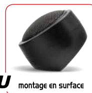
montage en surface