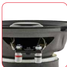
Borniers à vis de haute qualité